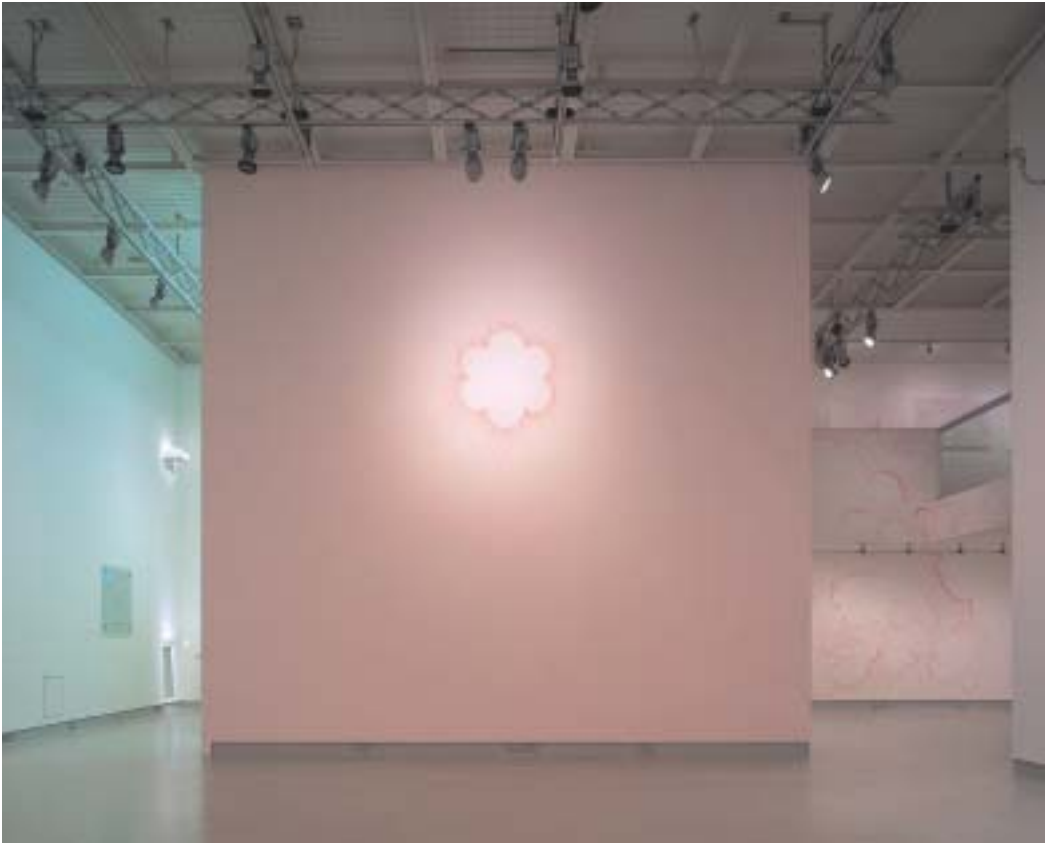
Pink Vacancy 2004 (銀座・資生堂ギャラリー での展示風景)