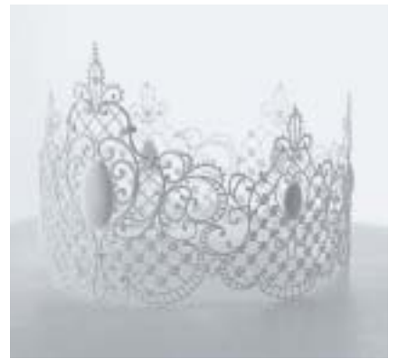
Sugar Crown 1999 砂糖、卵白 10.7×14×14cm

かめたかったんです」。さらに西山は、このような人間のあり方を探求する態度にこそ、美術を行う原点がある」と断言した。 京都芸大に戻り、ゲリラ的に構内各所にインスタレーションするようになる行為を始める。そのような、瞬間を捉える作品を考えるきっかけとなったのは、当時講師を務めていた元永定正の強烈なメッセージの影響もあった。「ここは展示スペースだと意識して作品を設置すること、みずから光がきれいと感じながら制作室でいじっていることが、なにか違うんですね。そのような距離を感じつつ、インスタレーションという行為に対して常にいろいろ考えてい