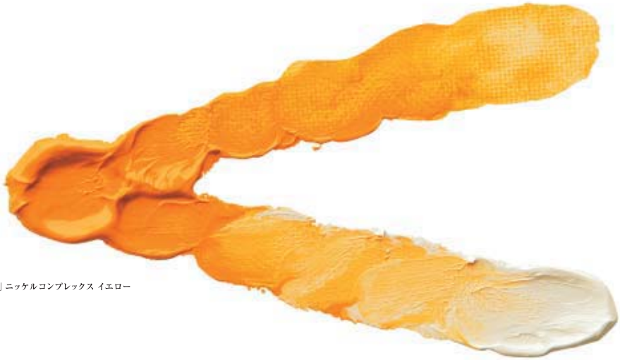
「油一」ニッケルコンプレックス イエロー