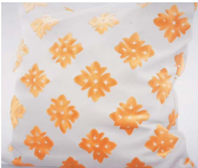
[untitled] 2006 キャンバスに油彩 75 × 90cm 個人蔵