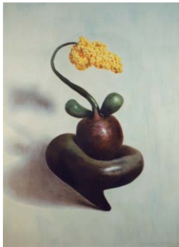
[untitled] 1993 シルクスクリーン、パステル 105 × 75cm

大学で助手を務めていた1994年、初めてフランスを旅した。美術館やギャラリーを回るなかで、ジャン＝マルク・ビュスタモントの作品と出会った