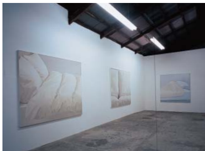
ノマルエディションでの個展(2004年)会場風景

2001年に一年間ニューヨークに滞在する。そこで実験を繰り返し、翌年帰国後さらに一年、03年によくやく再び作品を発表できるようになった。布団やクッションなど、「白いもの」のシリーズである。「クッションや柔らかい布系のもは、光の回り方が穏やかで拡散しているのが面白い」。以前の接写的な描写に対して、よ