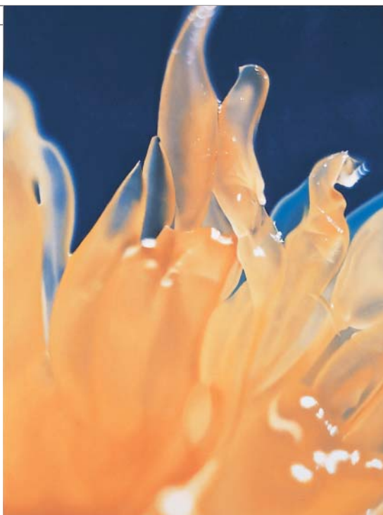
[ untitled ] 1999 キャンバスに油彩 163 x 123cm 個人蔵

「以前は、映像的なものの 介在が重要でしたが、 この時期以降、映像的 であることを乗り越えて、 『もの』と『観る人』が直接 つながれば、と思いました」