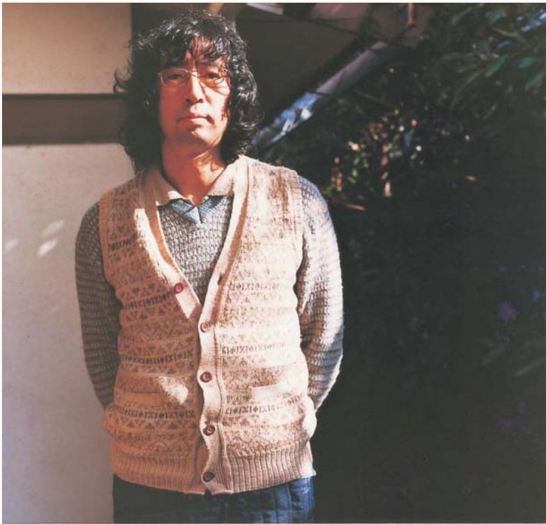
1975年、川崎市生田の自宅前にて。 この頃はまだアトリエを構えてはいなかった