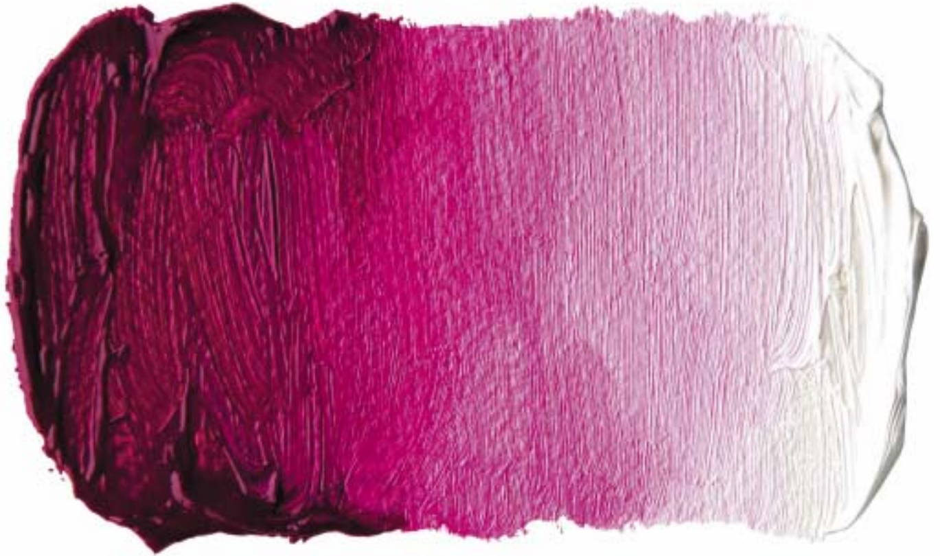
「油一」キナクリドンマゼンタ/セラミックホワイト