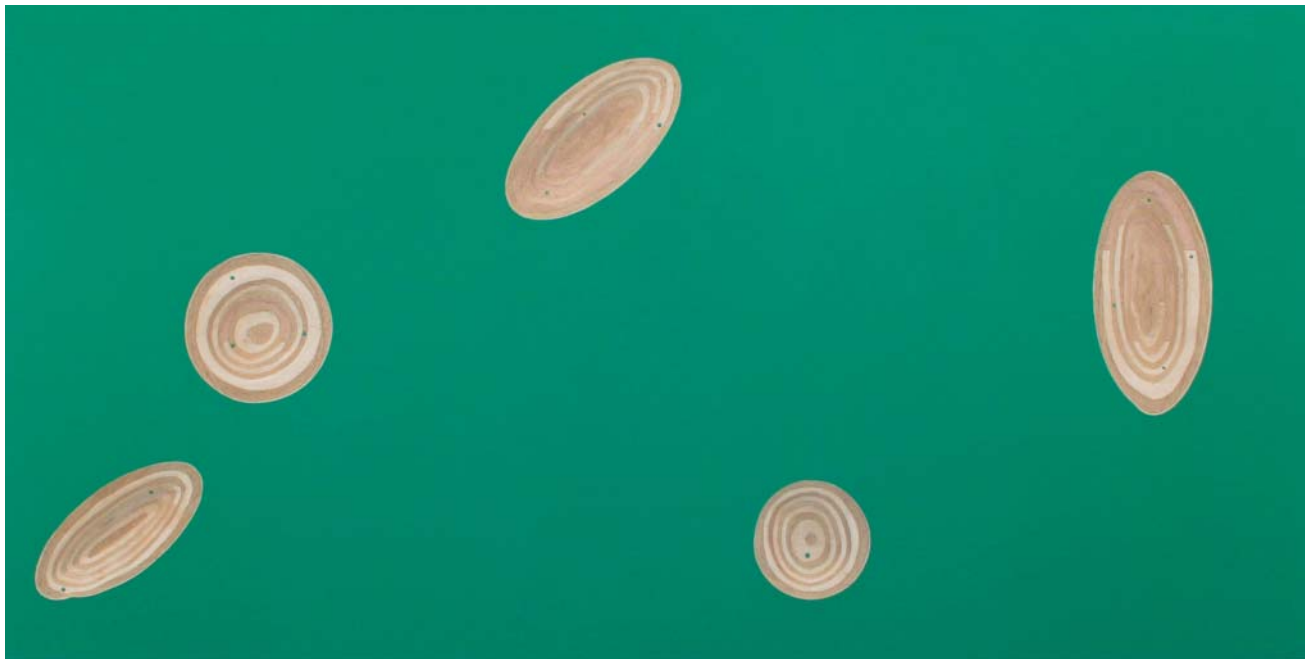
潜現化 2007 木にアクリル絵具 122×243×6.8cm