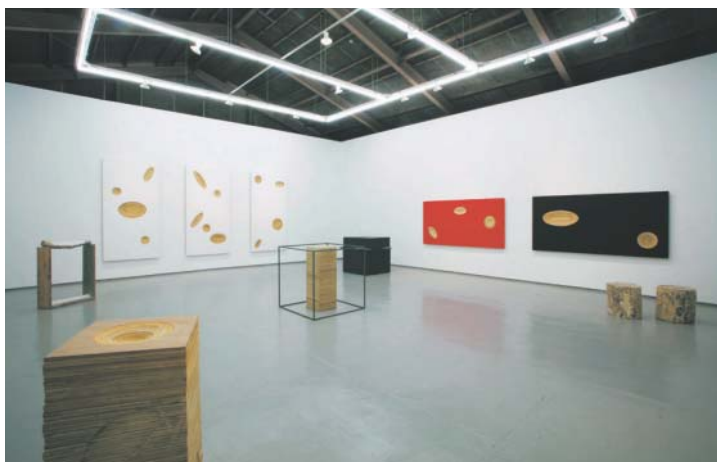
小山登美夫ギャラリーでの個展会場風景（2月9日 3月1日） [*]

ういうリアリティーを持ち得るのかということなんです。色を塗ったら、それを120%ぐらい活かすことによつてその物体は生きてくる、という考えでやっているんです。色という物体感なんです。……また、僕の中では白と赤それと黒、その三つが物