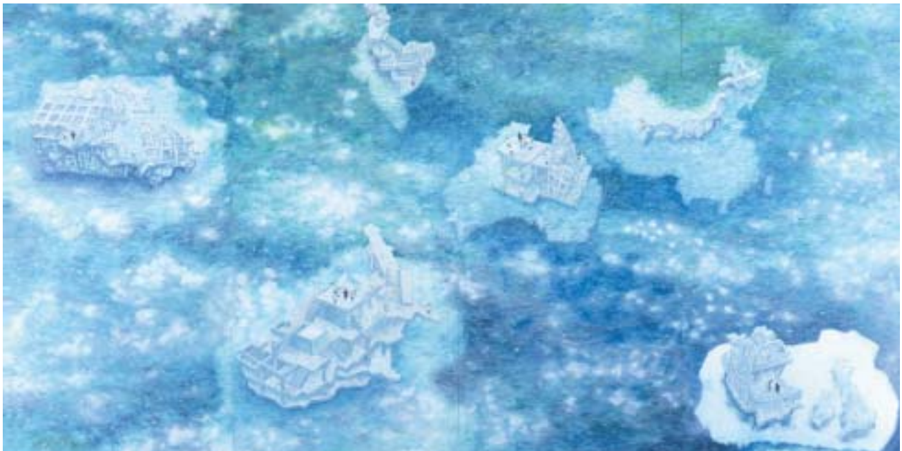
氷山 2007 キャンパスに油彩 227×444cm

「アメリカの財団から助成金を得て、家族でニューヨークへ。 国際的な美術マーケット、コレクター層の広がりを感じられました」