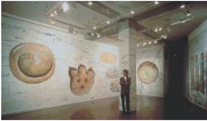
個展「アーバン・セル」(スカイドア・アートプレイス青山、1993)会場風景。東京の地図を拡大コピーした上に、合板に描いたアクリル画を並べた。合板を切り出した支持体=外形に、その内面、構造をグラフィカルに描いて充満させた、独特の浮遊感を持つ絵画は、鉛筆ドローイングにアクリルで彩色され、建築図面、設計図風だった