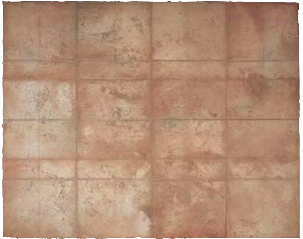
M.T.-98-1 1998 越前和紙、パステル、白色顔料 218×273cm