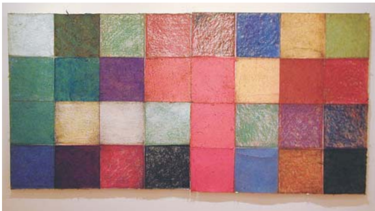
Mandara(2点組) 2004 越前和紙、パステル 各95.3×92cm

2004 「パステルを使うけれど、きれいになっちゃいけない。 ザラツとした感じになるまで、擦り込んでいくんです」